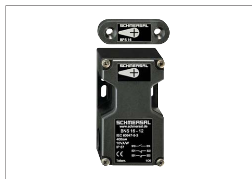
Fig. 2 : Interruptores de Seguridad y Sensores de Seguridad: Las dimensiones son iguales.

dad en cuanto a la Seguridad. Se recomienda mucho más que ésto, se deberán tener en cuenta las distintas opciones ofrecidas por el suministrador, o bien solicitar otras opciones necesarias para resultar adecuadas, a la Seguridad de la zona peligrosa concreta.