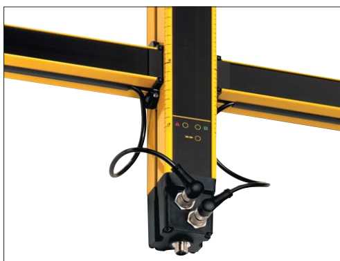
Fig.1: Nueva generación de Cortinas ópticas de Seguridad y de Barreras ópticas de Seguridad, que permiten diferenciar Personas y material, gracias a los Sensores de Muting integrados.

Las máquinas ofrecidas en el mercado, generalmente cumplen con la normativa referida a maquinaria y con lo que las prescripciones correspondientes aconsejan: vienen provistas de las siglas CE, y el fabricante define en la Documentación de la máquina, cuales son las Normas que han sido tenidas en cuenta. De ahí que el Director Técnico o bien el responsable de seguridad no se conformen con ésto, dada su responsabi-