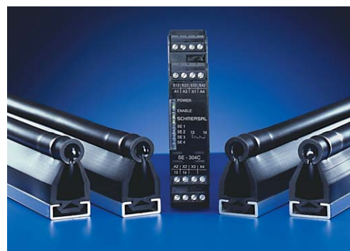
Fig. 4: Estos Perfiles de contacto de Seguridad, trabajan con el principio de accionamiento opto-electrónico: Un sensor infrarrojo detecta cuando el perfil de goma está presionado.

También resulta una importante cuestión, donde hay que situar el pulsador de desenclavamiento. La solución más elegante, es seguramente, junto a la empuñadura de la puerta, (fig 5). Los conmutadores de empuñadura de puerta de la serie TG, podrán equiparse con diversos elementos de accionamiento de Seguridad, como los pulsadores de Paro de Emergencia y un pulsador de Reset o desactivación.